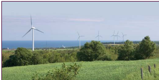
Table des paysages du Bas-Saint-Laurent

La Table des paysages du Bas-Saint-Laurent, animée par Ruralys, reprendra ses activités en septembre prochain grâce à un mandat d'animation de l'Entente sur le développement de la culture au Bas-Saint-Laurent (ministère de la Culture, des Communications et de la Condition féminine, CRÉ Bas-Saint-Laurent, Associations touristiques du Bas-Saint-Laurent et de la Gaspésie) pour la préparation d'un forum régional sur les paysages. Une demande de financement a d'autre part été faite pour l'organisation et la tenue d'un forum régional sur les paysages. À suivre!