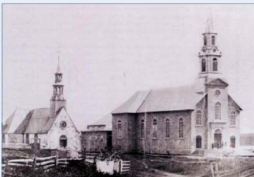
Les deux églises de Saint-Laurent, 1864, Studio Livernois

Pour la préhistoire, les facteurs environnementaux et les sites amérindiens connus sur l'île et dans la région suggèrent une fréquentation amérindienne probable à partir de 10 000 ans. Pour la période historique, le village possède un potentiel archéologique relié à une occupation à partir de 1679. Le noyau paroissial constitue un secteur névralgique avec une première église, un presbytère et un cimetière, noyau villageois qui évoluera au cours des siècles suivants. Des activités commerciales se feront principalement autour des chalouperies et des chantiers navals. Plusieurs zones à potentiel archéologique ont été définies, permettant ainsi une gestion et une planification des travaux d'excavation afin d'atténuer les impacts sur les ressources archéologiques.