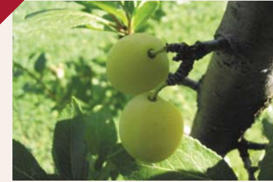
Prune Damas jaune

Origine : Damas en Syrie, introduite au régime français Diamètre moyen : 33 mm Hauteur moyenne : 23 mm Forme du fruit : Ovale à oblong Sommet : Arrondi, petit, marquée par une petite dépression ligéuse (point) Suture : Peu profonde, légèrement marquée Cavité pédonculaire : Moyennement profonde, renflement formant un collet Texture : Lisse, peu épaisse Couleur : Jaune or, rosé du côté du soleil Chair : Jaune dorée, juteuse, un peu molle Noyau : Assez gros, semi-adhérent Saveur : Sucrée, légèrement acidulée, fruitée, très bon goût Qualités culinaires : à croquer, confiture, conserves