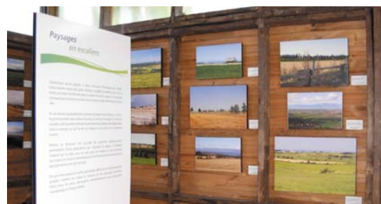
Exposition à l'Espace 150 e -Batitech, La Pocatière, septembre 2009

Les partenaires du projet sont la Ville de La Pocatière, la Table des paysages du Bas-Saint-Laurent, les Fêtes du 150 e anniversaire de l'enseignement agricole au Canada, la Conférence régionale des élus du Bas-Saint-Laurent et le Musée régional de Kamouraska.