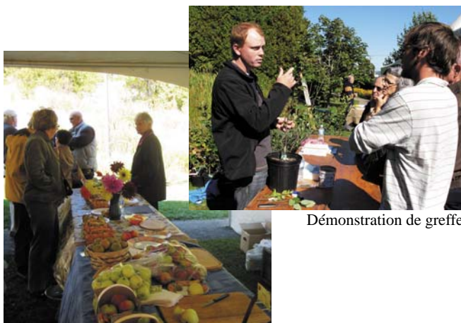
Démonstration de greffe

Merci de votre participation! Nous vous donnons rendez-vous en septembre 2010!