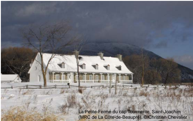
La Petite-Ferme du cap Tourmente, Saint-Joachim (MRC de La Côte-de-Beaupré).

Ruralys vous souhaite un joyeux Noël et une bonne année 2010 !