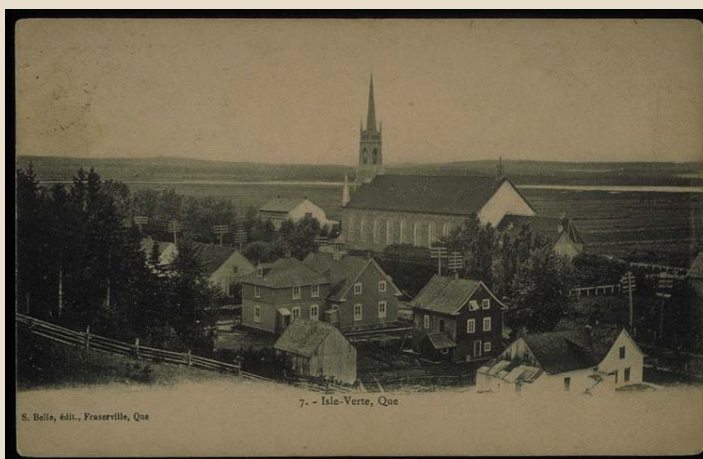
Village de L'Isle-Verte vers 1891

En vue du classement par le gouvernement du Québec de l'église de La-Décollation-de-Saint-Jean-Baptiste de L'Isle-Verte, le ministère de la Culture, des Communications et de la Condition féminine du Québec nous a donné le mandat de réaliser une étude historique et archéologique sur le site de l'église de La-Décollation-de-Saint-Jean-Baptiste de L'Isle-Verte. Cette étude a permis de comprendre l'occupation complexe et intensive de ce site qui commence à partir de la fin du XVIII e siècle et d'en connaître son potentiel archéologique. Ce noyau paroissial est composé de plusieurs bâtiments patrimoniaux d'intérêt, sans compter son église d'influence néogothique construite de 1846 à 1855, selon des plans attribués à l'architecte Charles-Philippe-Ferdinand Baillargé (1826-1906). Plusieurs bâtiments et aménagements se sont succédés sur la propriété de la Fabrique : des chapelles, une première église, un cimetière, un charnier, des presbytères, une école, des dépendances, des monuments et des aménagements paysagers. Cette étude permettra une gestion éclairée des patrimoines de ce site, tant d'un point de vue de sa protection que de sa mise en valeur.