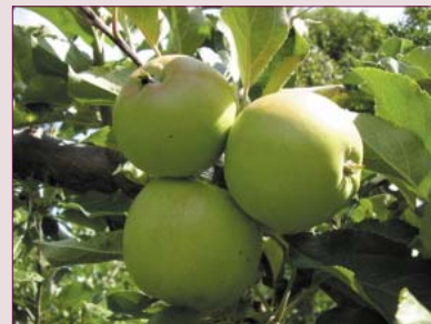
Pomme Tolman Sweet